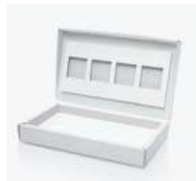
Opakowania z tektury litej