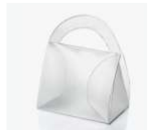
Opakowania z polipropylenu