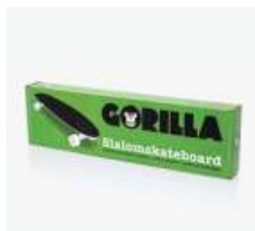
Drukowana tektura falista